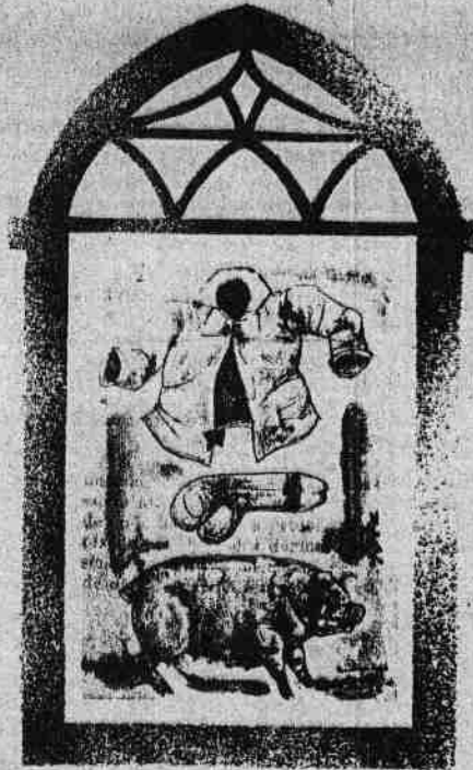
Ilustrações do Livro ARGILA DA MEMÓRIA de Clóvis Moura.